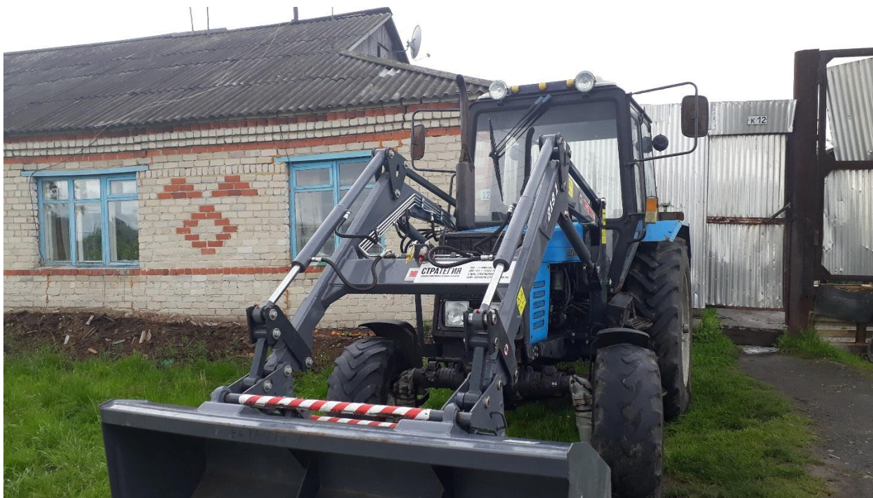
Погрузчик в Туринске