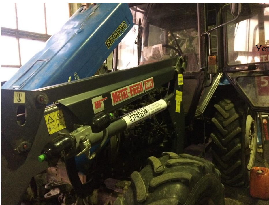
Установка погрузчика на трактор силами нашей сервисной службы

Общество с ограниченной ответственностью «Стратегия 96» 620098, г. Екатеринбург, пер. Вишерский, дом 4 ИНН 6686075417 КПП668601001 р/с 40702810516540026954 УРАЛЬСКИЙ БАНК ПАО СБЕРБАНК г. Екатеринбург к/с 30101810500000000674 БИК 046577674